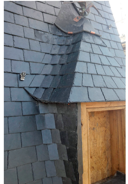
Montigny le tilleul - Noues rondes sur lucarne et versant de couverture.